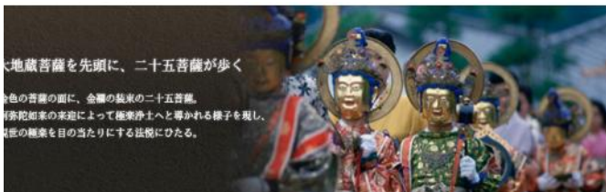
大地蔵菩薩を先頭に、二十五菩薩が歩く 各色の菩薩の面に、金華の秘宝の二十五菩薩。 阿彌陀如來の来迎によって極樂浄土へと導かれる様子を現し、 信者の福樂を目の当たりにする法眼にむける。