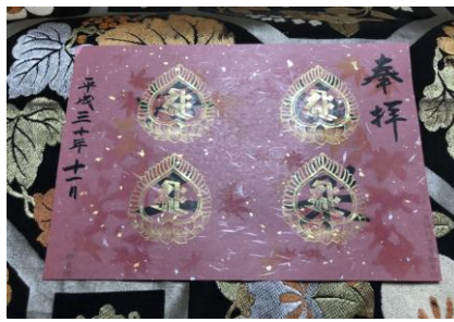
十一月一日〜二十三日 紅葉まつり・特別拝観

JR 東海 そうだ京都、行こう。 会員限定オリジナルイベント に協力させていただきました。 http://souda-kyoto.jp/card_member/event/keisyukuyoku_gosyuin.html