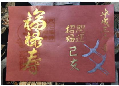
一月一日〜成人の日迄 福祿寿 七福神巡り