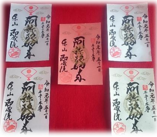
色は5色 1枚500円で授与

季節限定特別御朱印のご紹介（※内容は変更する場合がございます） 即成院期間限定の特別御朱印お授けのご紹介です。 大護摩法要（不動明王） 令和元年 五月第四日曜日 令和元年最初の特別御朱印授与は 全てが 特別散華付（不動明王種字）です。