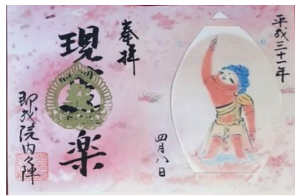
四月一日〜三十日 花まつり法要(散華付)