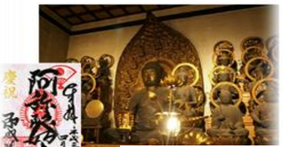
内々陣：現世極楽浄土 特別拝観 公開中

【授与所】 本堂受付 9:00 ~ 17:00 その他、お寺の情報はコチラから http://www.negaigamatoe.com