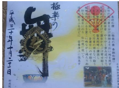
十月 第三日曜日 二十五菩薩お練り供養法会